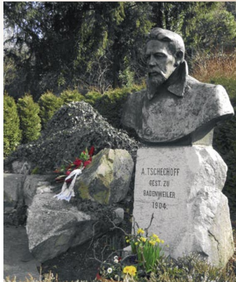
Das neue Tschechow-Denkmal in Badenweiler auf dem Sockel von 1908, gestiftet 1992 von den Tschechow-Freunden der Insel Sachalin

An die Geschäftsstelle der Deutschen Tschechow-Gesellschaft e.V. Luisenstraße 5 D-79410 Badenweiler