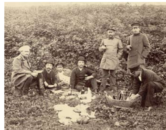
(Anton Tschechow 2. v. re.)

Музыкальные поэтические чтения: „Пути к современности“ – Владимир Маяковский – Александр Блок – Сергей Прокофьев.