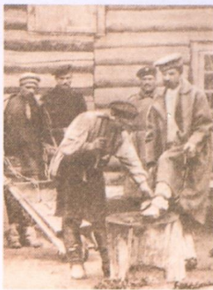
12 ⚡ Остров Сахалин. Заковка катоджан