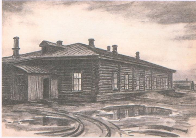
11 ⚡ Остров Сахалин. Одно из бывших тюремных зданий в городе Александровске. Рисунок С. М. и С. С. Чеховых